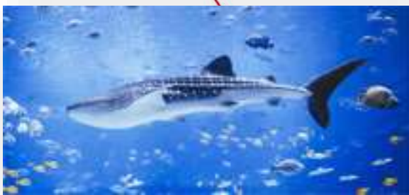
Poema del Mar – Acuario de Las Palmas