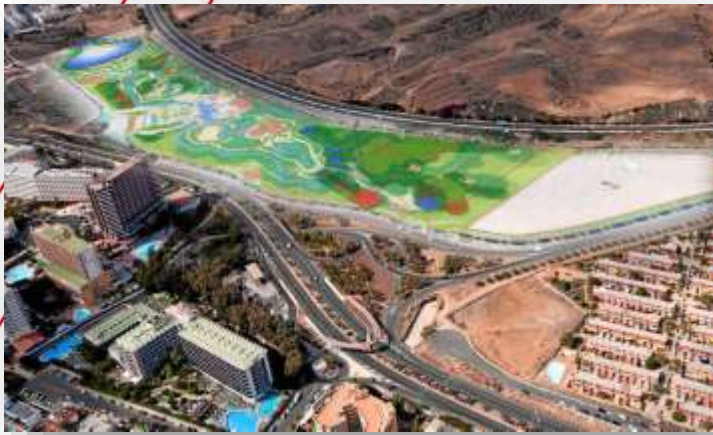
Vista del proyecto

De cumplirse los plazos, las obras de canalización de los cauces públicos en dirección al mar en el terreno de 174.000 m 2 del futuro parque acuático con un coste de alrededor de 2 millones de euros deberían estar concluidas próximamente.